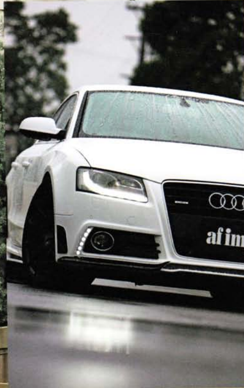
LEDライトのデザインとバンパーの独特なLEDラインが絶妙なハーモニーを演出する。昼間はバンパーの形状でさり気なく、夜間は光モノで存在感を

横からのフォルムを作り上げる堂々としたデザイン。塗り分けテクを駆使することで、軽快さも表現される。リアもアイフューザーのみではなく、バンパーから交換する形状。より刺激的なテールデザインを演出してくれている。前後ともバンパータイプと聞くと、あまりにも激し過ぎると敬遠するかもしれない。しかし、写真を見ればわかるように、アウディのスタイリッシュさをまったく犠牲にすることなく、個性をプラスしたという雰囲気を感じ出している。