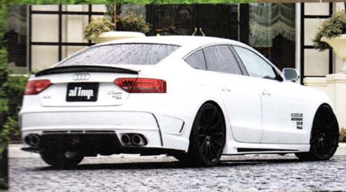
よりスポーティな印象を付けた印象のリアスタイル。ロウエンのA5用エアロパーツの中で一番大胆なデザインと感ぜるが、決して突飛さがないのがさすが。マフラーも注目アイテムなのだ