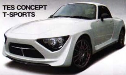
TES CONCEPT T-SPORTS