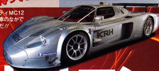
青山王子のマセラティMC12 も特別展示。出展車のなかで 最も高価なクルマだ!!