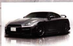
Silver Wolf Edition