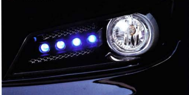
FRP製マットブラック塗装仕上げ。LEDは片側4発計8発で、ブルーが6万5100円、ホワイトが6万900円だ。なお、適合はSパッケージ専用となる。

面ももちろんあるが、その上で車体側面を流れる走行風からダウンフォースを生み出すことで、直進性を安定させるといふ効果を持つ。この張り出しは多すぎると抵抗になり、少なければ効果が無いがそこはトミーカイラ、ベストバランスで設定されている。このフラップが装着されて車両全体の完成度を増す。