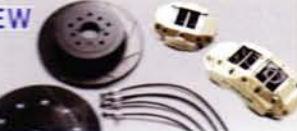
SPORTS BRAKE KIT