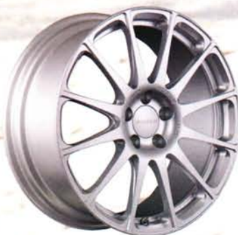
2011 NEW MODEL ON SALE 受注生産 GC-012L