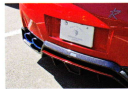
エアロパーツはカーボン製。ドレスアップしたヘッドライトなどもある

個性的なフォルムを実現するエアロパーツなど、高品質なパーツをリリースするトミーカイラ。ブースには、同社のカスタマイズ工房「TKファクトリー」でチューニングを施した2台のR35を展示していた。どちらも同社の11点からなるエアロパーツを装着。赤いボディのR35は、ビッグスロットル、オリジナルマフラー&CPU、スポーツサスペンションキットなどを装着する