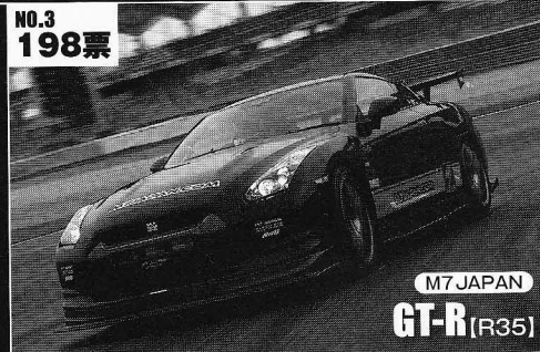
M7 JAPAN GT-R (R35)