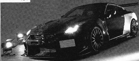
NISSAN NOB Taniguchi GT-R (R35)