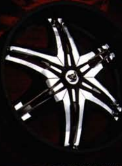
PLATINUM BLACK RIM WITH CHROME AND BLACK INSERTS