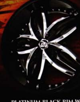
PLATINUM BLACK RIM WITH CHROME INSERTS