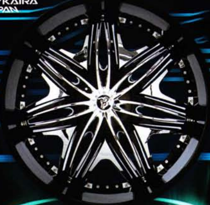
BLACK MESH <ブラックメッシュ> BLACK RIM WITH CHROME INSERTS