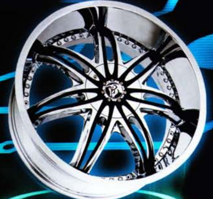
CHROME FIN <クロームフィン> CHROME RIM WITH BLACK INSERTS