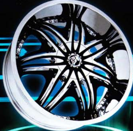
CHROME MESH <クロームメッシュ> CHROME RIM WITH BLACK INSERTS