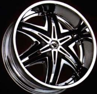
CHROME RIM WITH BLACK AND CHROME INSERTS