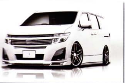
Comingsoon!! ELGRAND HIGHWAY STAR E52