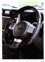
カーボンのステアリングで、インテリアにもスポーティなムードを。グリップはブラックレザー×レッドステッチなど多数ある。