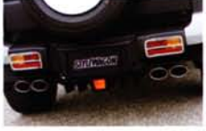
リアのアンダー部に装着するディフューザー。フィンデザインがグッド! センターのバックフォグは点滅タイプもあり。