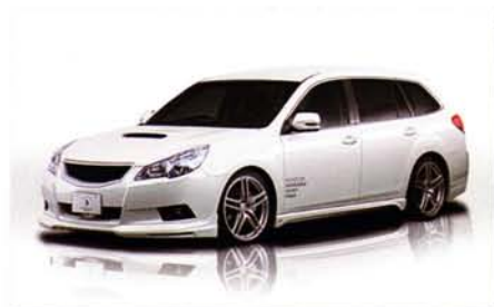
PREMIUM Edition LEGACY TOURING WAGON BR9