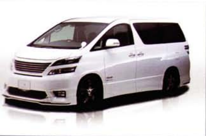
Vestitá Edition VELLFIRE-Z ANH/GGH20