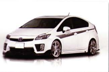
ECO-SPO PRIUS RR ZVW30