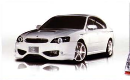
Tommykaira Edition LEGACY TOURING WAGON BP