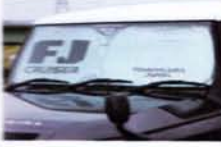
ここからの乗客に直達するサンシェード。トミーカーイラとFJクルーザーのロゴ入りで、お洒落なくブランドアピール。