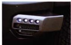
バンパー左右に突き出したエクステンションカバーには、4連のLEDが仕込まれており、モダンな雰囲気をアップさせる。