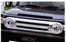
ヘッドライトからグリル部分まで覆うフロントグリルカバーは、1本の太めルーバーの効果でクロカン顔から激変する。