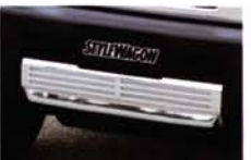
バンパー中央部に装着してアクセントを付けるフロントスポイラー。スリット状のラインは、メッシュとなっている。