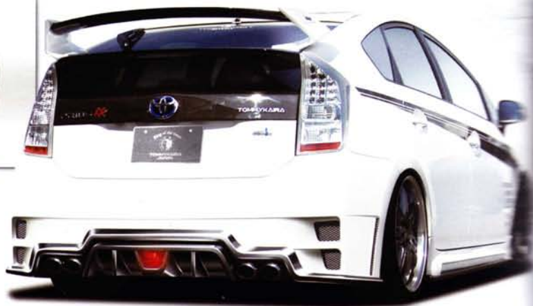
The Notable Parts RearBumper... Comingsoon!!