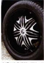
本場USラグジュアリーホイールのディアプロ モーフィアスをセット。超深リム+個性派デザインがFJにマッチする。