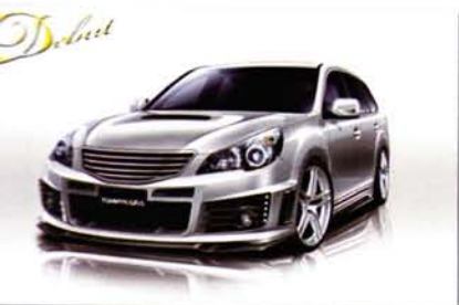
PREMIUM Edition LEGACY TOURING WAGON BR9 RR