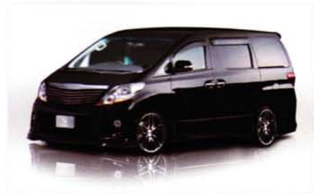
Vestitá Edition ALPHARD-S ANH/GGH20