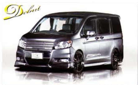
Vestitá Edition STEPWGN SPADA RK5