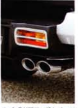
メッキのリアフォグカバーが丁度いいアクセント。マフラーはアンダーディフューザーのほか、純正バンパー対応もある。