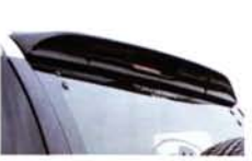
大きくくくれたような形状のルーフスポイラーは、スポーティな印象すら与えることができる独特なデザインだ。