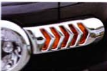
ウインカーの上に貼せるだけでOKのカバー。矢印状のデザインが、個性的一気に印象的な雰囲気を醸しだしてくれる。

いやフロントスポイラーといったFJの印象をガラッと変えるものから、エンブレムやリアフォグカバーなどのワンポイントアクセントまで様々。パーツ点数が豊富にあるので印象が変わるだけでなく、そのどれもがトミーカーイラらしいモダンなデザインとなっている。とくにウインカーカバーの矢印状のデザインをみれば納得するはず。スタイルアップにもついでにラインアップだ。