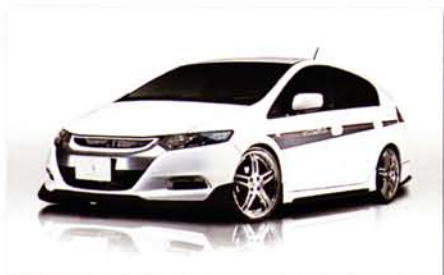
ECO-SPO INSIGHT RR ZE2