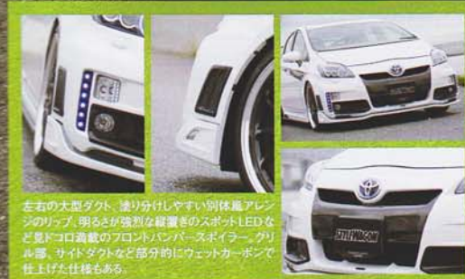
見どころ満載の フロントバンパー

左右の大型ダクト、塗り分けしやすい別体エアレンスのリップ、明るさが強いLEDなど見どころ満載のフロントバンパー。スポイラー、グリル部、サイドダクトなど部分的にウェットカーボンで仕上げた仕様もある。