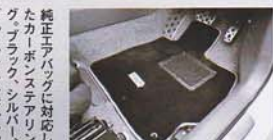
スポーツ走行に支障がな い程度にまで手足を伸 ばし、高剛性に仕上げた フロアマット

トミーカイラから30プリウス用の前後バンパーエアロが登場。既存のハイタイプに続く第2段で、プリウスR・GTと名付けられる。特徴は見るからに過激なエアロデザインだ。ダクトやプレスラインを多用し、どの面から見ても、バンパーならではの変わった感が得られる。また、バンパーの一部はカーボン仕様も選べ、さらにマフラーはテールエンドだけじゃなくパイプも含めたフルチタン仕上げ。素材とデザインにこだわりの、スポーティさを全面に押し出したユーロ系エアロだ。前後バンパー&チタンマフラーに加え、ボンネットスポイラーとリアウイングも新たに登場。リアウイングはさらに過激さを高めるGTウイング風だ。