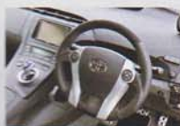
純正エアバウグに最適 なカーボンステアリン グフラックシルバ ブルーオレインシ アール