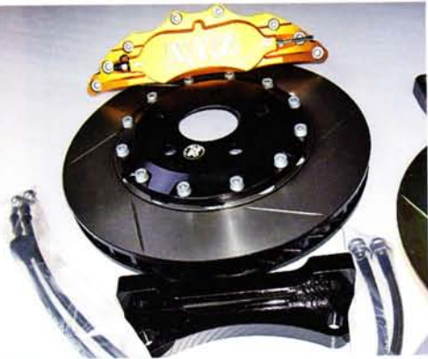
ALL 6piston Caliper 価格: 22万8900~45万9900円

US AUTO TRADING (ユーエスオートトレーディング) [082]430-4265 www.usat.co.jp エックスワイゼットレーシング