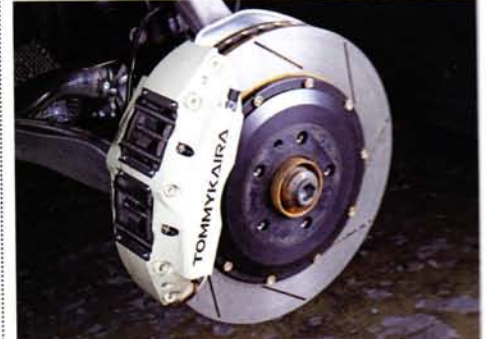
ALL High Performance Brake System 価格: 36万7500円

ロウエン TOMMYKAIRA (トミーカイラジャパン) [0565]52-8555 www.tommykaira.com