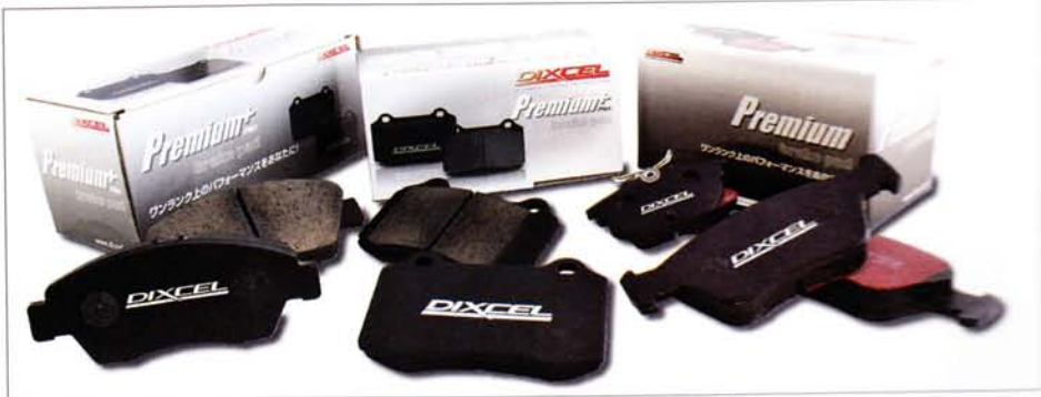
ALL Premium TYPE black pad 価格: F&R / 8400~3万1500円