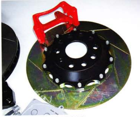
ALL Rear Big Rotor Kit (2 PEACE) 価格: 8万1900円

WTCCという過酷なレースにスポンサーとして参戦して開発されたXYZのブレーキシステムは、アルミ製軽量キャリパーと2ピースベンチスリットローターを組み合わせて、ブレーキング時に強力なストッピングパワーを生み出す。リア用には、放熱性をよくするため2ピース構造でスリットを入れたビッグローターをラインナップ。ゴルフVやアウディTTのような純正リアキャリパーにサイドブレーキが組み込まれているような車種でも、キャリパーは交換せずにブレーキの強化を図ることができるという。