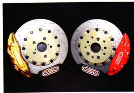
ALL CSD BRAKE SYSTEM 価格: 26万5997円~

シーエスディー CSD (シーエスディー) [0836]67-0333 www.kcarbland.com