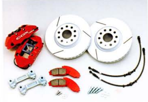
MONOBLOCK CALIPER KIT 価格: 20万4750円

コックス COX コックス [0465]81-3034 www.cox.co.jp