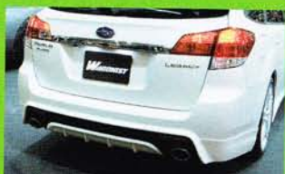
リヤのAライン内には、トミーカイラらしい機能性を予感させるディフューザー形状を採用する。デモカーのように塗り分けて使うのもジャストな意匠だ