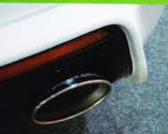
マフラーは、純正バンパー用だけでなくエアロ専用に対処させたスライド式の2タイプを設定。センター&フロントパイプも用意する