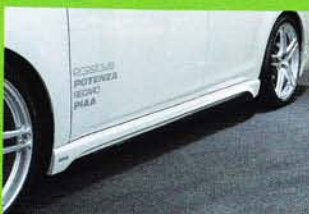
サイドステップにも鋭く切れ上がったAラインをデザイン。リザ形状となるから存在感も高く、立体感や奥行き感も的確に向上できるゾ