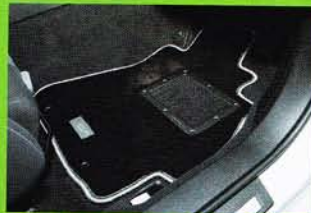
スポーツ走行可能な程度まで毛足を伸ばした質感上々のフロアマット。密度も高く、ヒールプレートやメタルロコプレートも付属させるなど高級仕立てだ