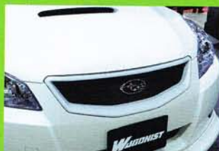
純正開口部をできる限り大きく見せることが可能なフロントグリルは、精神を鎮つきの極となる部分。ファン付きとなるエレガントな別バージョンもラインアップ済み!

機能性ありきを原則とする骨太ブランド、トミーカイラが立ち上げたプレミアムエディションの第2弾がついに完成。前後ともに小振りなハーフスポイラーを採用しつつも、エッジの効いたAラインやディフューザー風リヤデザイン、さらにダクトなどの投入によって絶対的なスポーツマインドを宿したのが最大の魅力だ。純正ボディラインや機能を生かしながらも、強烈なイメージチェンジを図れる注目プログラムといえる。