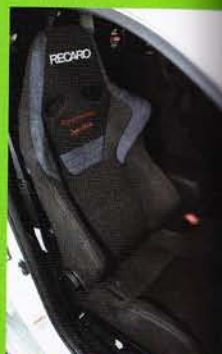
トミーカイラ・バージョンのレカロシートは、車内にも使えるリクライニングタイプ。スポーツ走行やロングドライブ時に活躍する