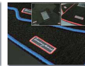
フロアマット カラー: BLUE/BLACK, RED/BLACK, BLACK/BLACK ¥29,400 (税込)