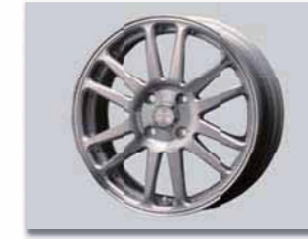
Super eco sports 1555 45 4-100 鍛造 1P ¥49,875 (税込)