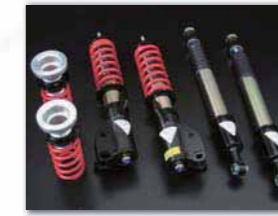
車高調 KIT ¥239,400 (税込)