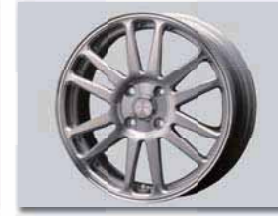
Super eco sports 1660 53 4-100 鍛造 1P ¥54,600 (税込)