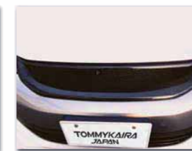
カーボン製フロントグリル 素地: ¥39,900 (税込) 塗装済: ¥43,050 (税込)