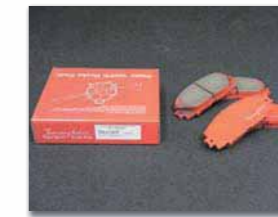
フロントブレーキディスクパッド ¥12,600 (税込)