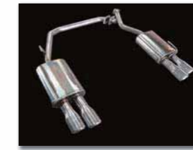
Rear Muffler (デュアルレイアウト) ¥110,250 (税込)