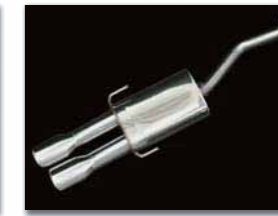
Rear Muffler ¥71,400 (税込)