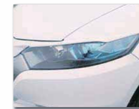
アイラインガーニッシュ 素地: ¥15,750 (税込) 塗装済: ¥21,000 (税込)